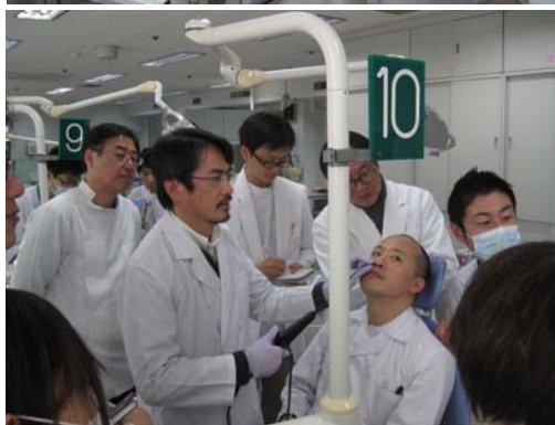
各班に分かれての実習