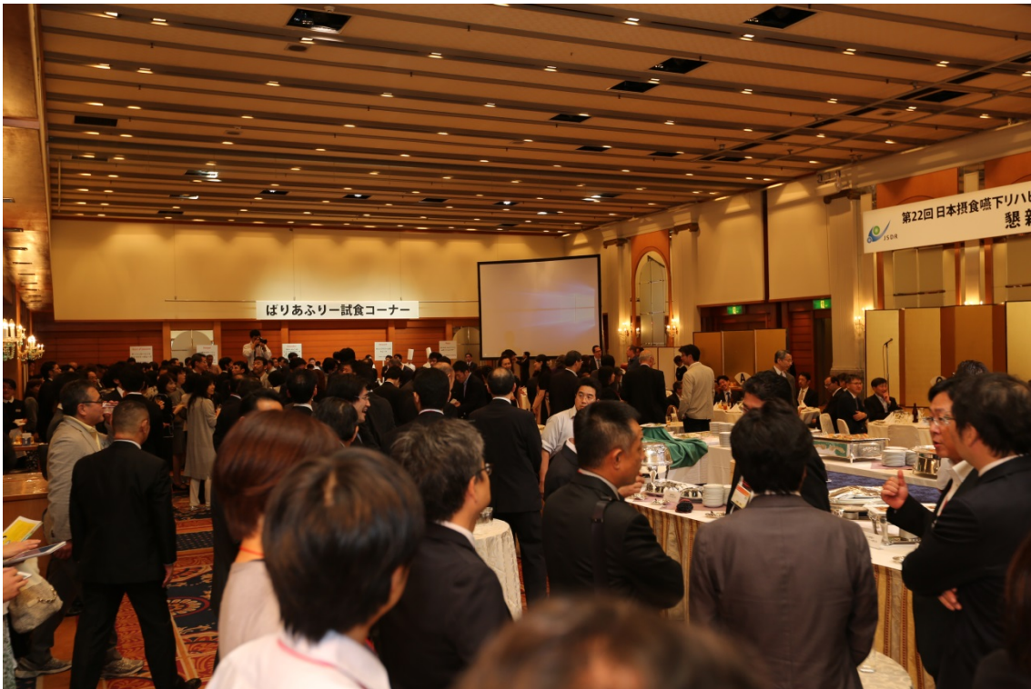
懇親会時、正面のパネルより光っていた「はりあふりー」のコーナー。