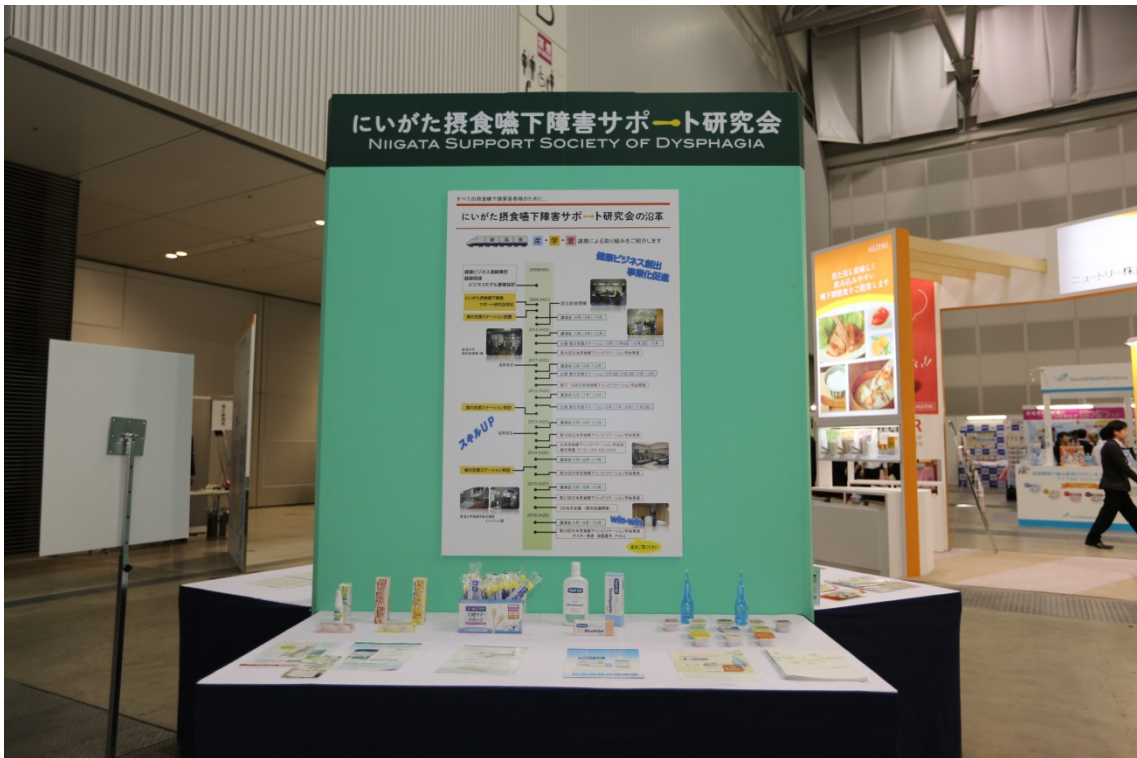
アルビカラー，ではなく緑を基調にしたブースは目立っていました！