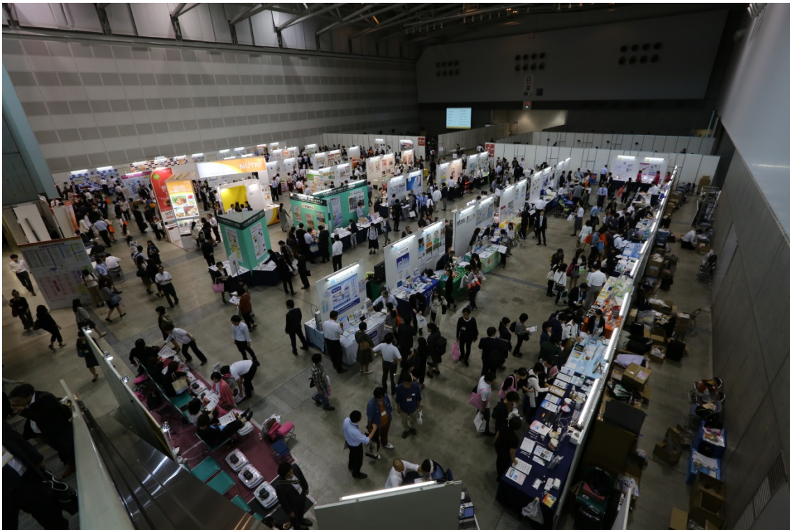
企業展示の一番手前にあったため、多くの方の目に止まりました。