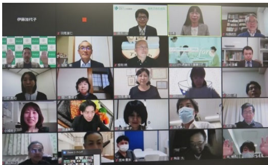
参加して下さった皆様の一部